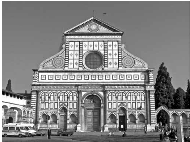
(Igreja de Santa Maria Novella, Florença, Itália. Fachada da segunda metade do século XV.)

De 1050 até 1350, na Europa ocidental, foram extraídas milhões de pedras para construir 80 catedrais, 500 grandes igrejas e milhares de igrejas paroquiais. A partir do século XII, em algumas igrejas, as paredes perderam a sua função estática e os monumentos tornaram-se predominantemente verticais. Paredes mínimas e áreas máximas de vidro brilhante caracterizavam as novas construções.