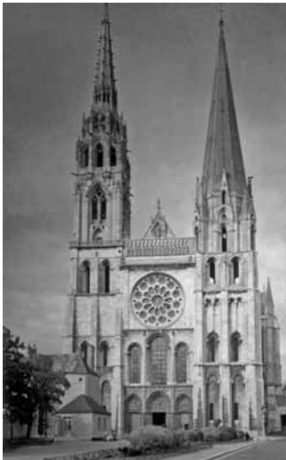
(Catedral de Chartres, França, construída a partir do século XII.)